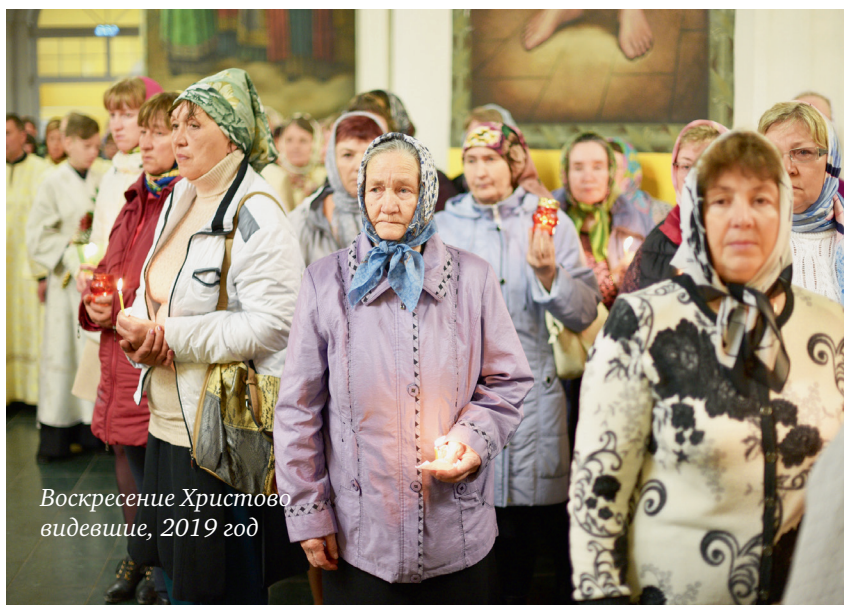
Воскресение Христово видевшие, 2019 год