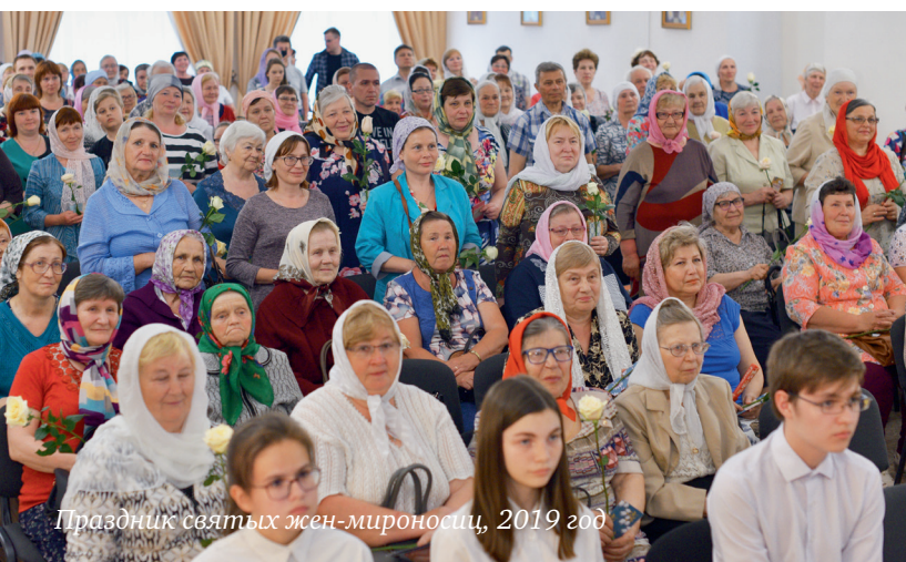
Праздник святых жен-мироносиц, 2019 год