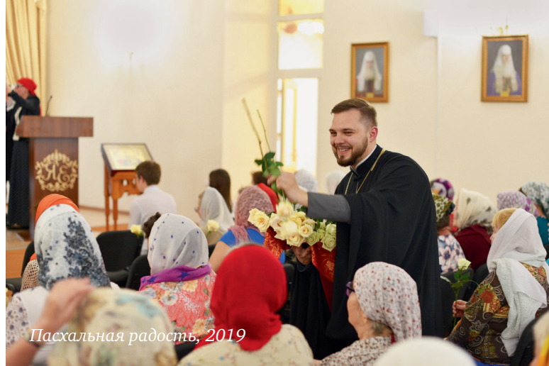
Пасхальная радость, 2019