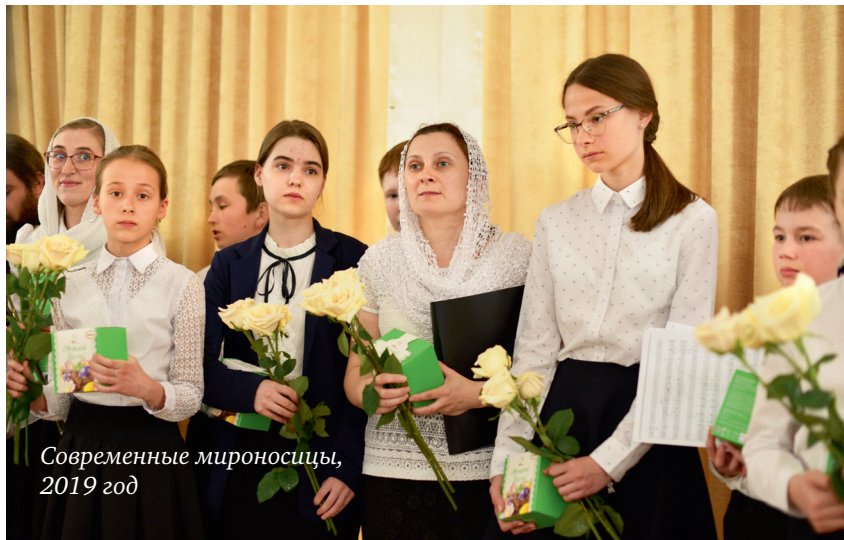
Современные мироносицы, 2019 год