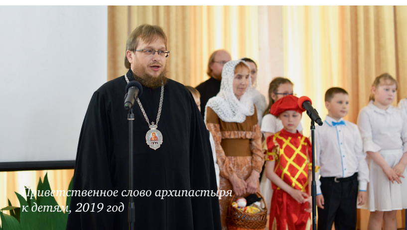
Приветственное слово архипастыря к детям, 2019 год