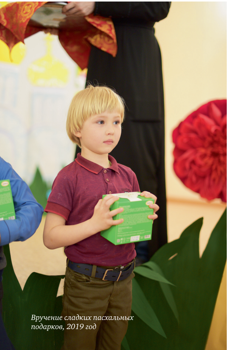
Вручение сладких пасхальных подарков, 2019 год