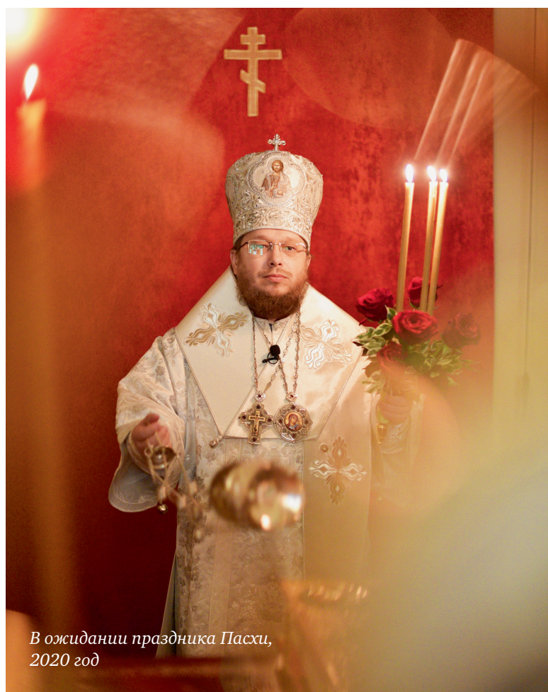
В ожидании праздника Пасхи, 2020 год