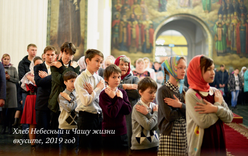
Хлеб Небесный и Чашу жизни вкусите, 2019 год