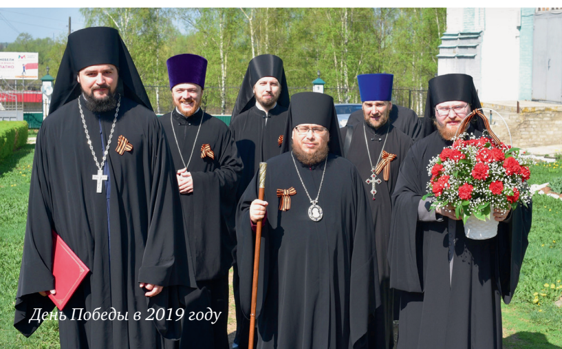
День Победы в 2019 году