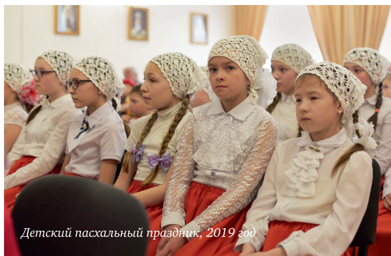
Детский пасхальный праздник, 2019 год