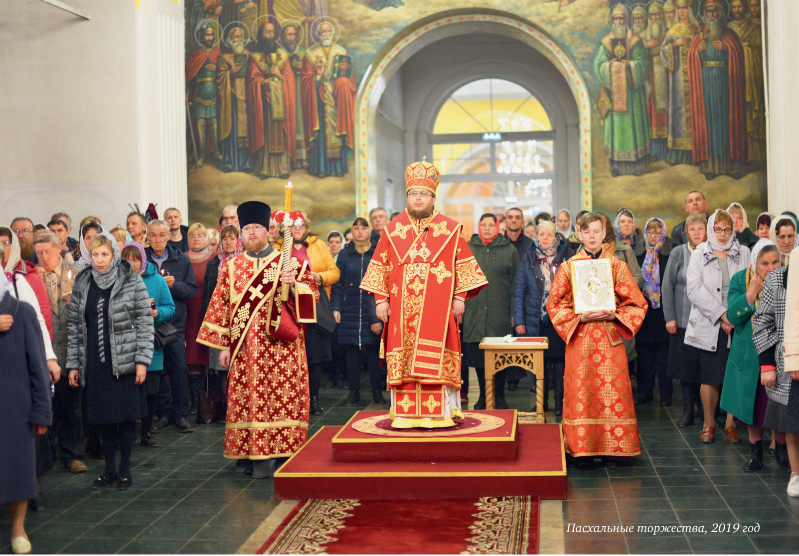
Пасхальные торжества, 2019 год